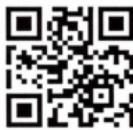
ผลตรวจอำเภออรัญประเทศ

๔.๓.๖.๓ ขอแจ้งดำเนินการตรวจเตือนเฝ้าระวังและบังคับใช้กฎหมายตาม พรบ.ควบคุมเครื่องดื่มแอลกอฮอล์ พ.ศ. ๒๕๕๑ ในช่วงเทศกาลสงกรานต์ ระหว่างวันที่ ๑๐-๑๖ เมษายน ๒๕๖๔ พร้อมทั้งรายงานผลการดำเนินงานและภาพกิจกรรมได้ทุกวัน